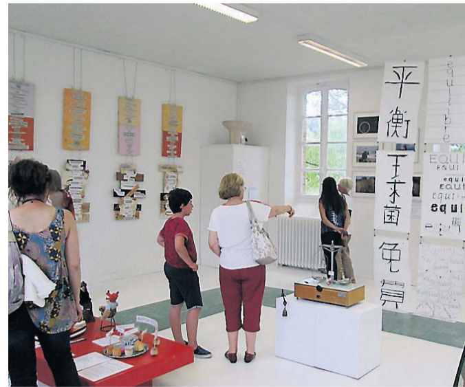
L'expo «Ah! Ah! Art» est ouverte à l'ancienne école et c'est gratuit.