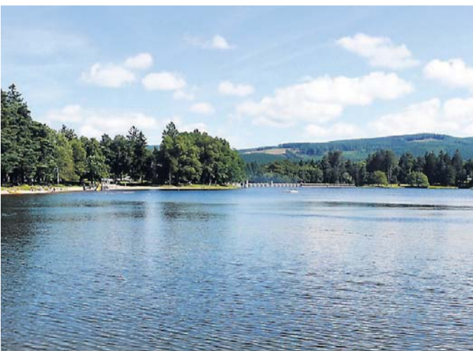
Le spectacle sera grandiose au Lac des Montagnès.

Le samedi 16 juillet, avant le feu d'artifice tiré aux alentours de 22h30, les spectateurs pourront en début de soirée applaudir le spectacle des fanfares qui défilent en musique. Ils pourront également se restaurer au bord du lac où se tiendra le village gourmand.